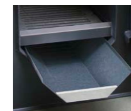
Plateau des cendres sur tous les modèles