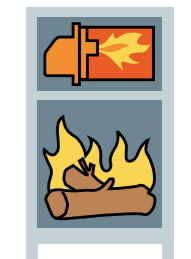
Solides + gasoil simultanément