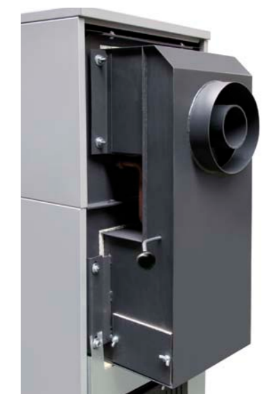
2 Espaces de combustion avec 1 seule sortie de cheminée